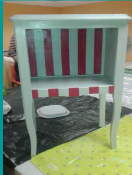
Illustration 1: ...des rayures