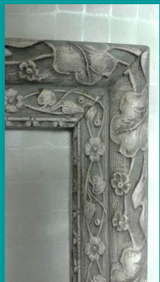
Illustration 5: cadre restauré et peint