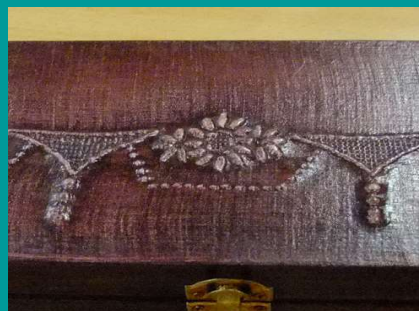
Illustration 6: broderies insérées, peintes et patinées