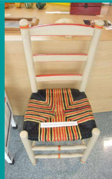
Illustration 2: pailles peintes