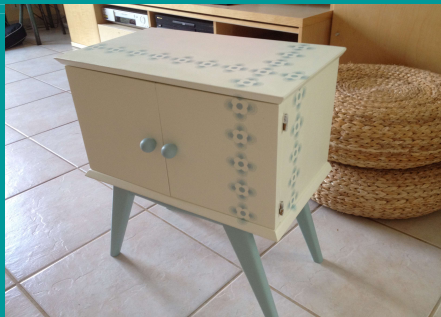
Illustration 5: petit meuble verni refait façon vintage