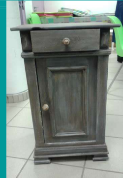
Illustration 4: travail de gris à l'éponge